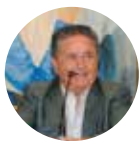
Eduardo Duhalde Expresidente de Argentina