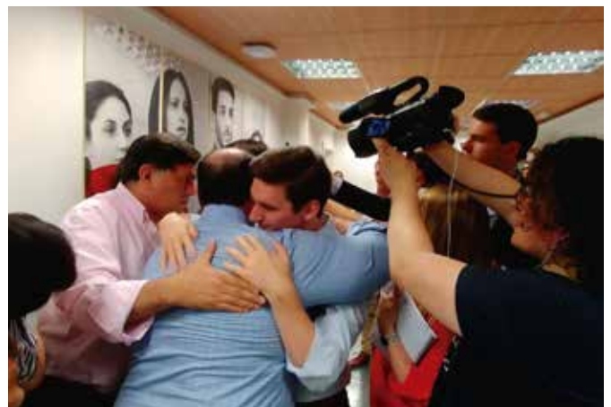
Gestión de crisis