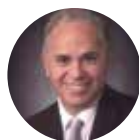
Galo Limón Presidente del Instituto Mejores Gobernantes.