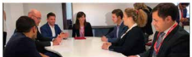
Reunión presidentes estados de Atlántida