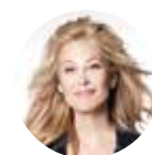
Teresa Viejo Periodista, escritora y presentadora de televisión