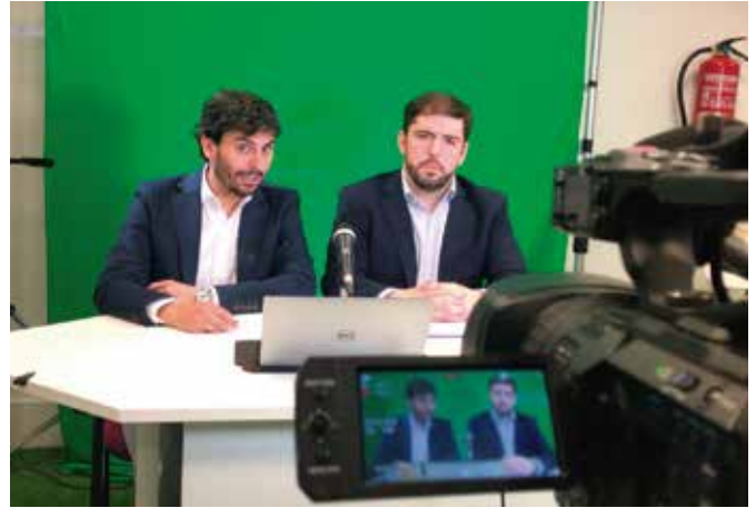
Rueda de prensa y entrevista