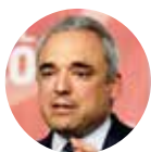
Rafael Simancas Diputado de España