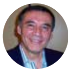
Jamil Mahuad Expresidente de Ecuador y profesor de la Harvard Kennedy School