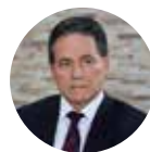
Arístides Royo, Expresidente de Panamá