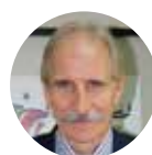
Carmelo Angulo Expresidente de UNICEF España