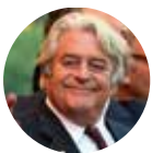
Luis Alberto Lacalle Expresidente de Uruguay