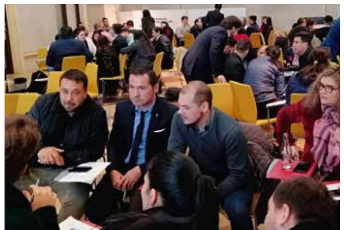
Lobby y negociación