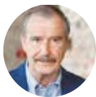
Vicente Fox Expresidente de México